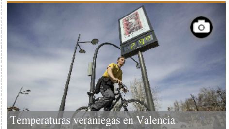
Temperaturas veraniegas en Valencia